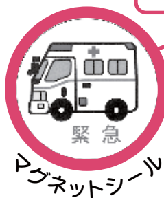
マグネットシール

緊急医療情報キットが 冷蔵庫内にあることを 知らせるために、マグ ネットを冷蔵庫の外扉 に貼ります。