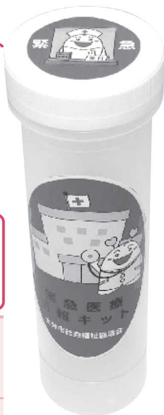
緊急医療情報 キット本体