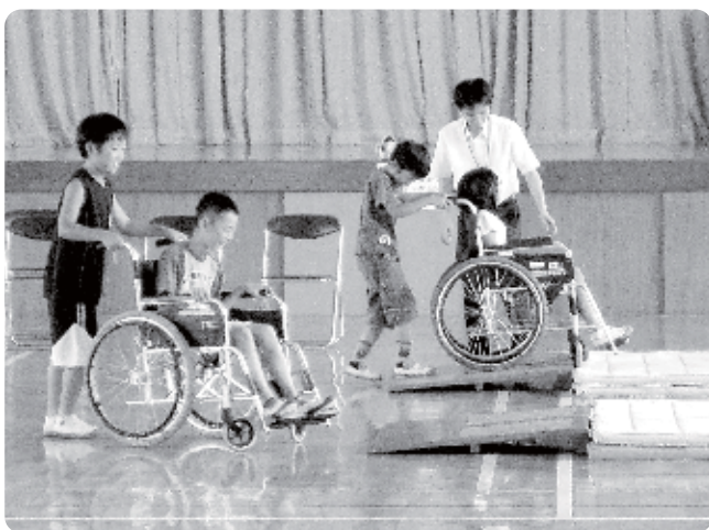
小さい段差も難しいよ(車イス体験)

その結果、福祉学習講座の実施回数が、前年度の12校から24校（参加者2,743名）へと大幅に増加いたしました。また、様々な福祉関係団体に講座の講師として、ご協力いただき充実したものになりました。