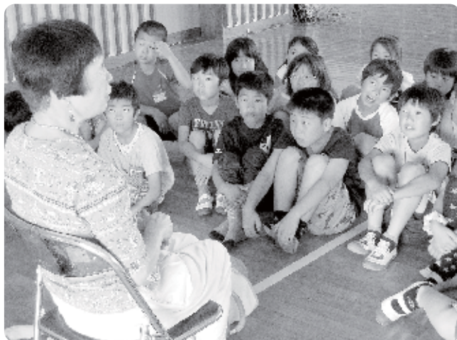
「視覚障がい」についての講話に熱心に耳を傾ける児童