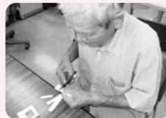
古切手の整理中です！

大分市ボランティアセンターでは、使用済み切手やメータースタンプを集めています！これは「発展途上国へ送る医療品の購入資金やアジアの子ども達の教育支援など」に役立てられています。是非、職場、学校、家庭などで集める活動をしてみませんか？