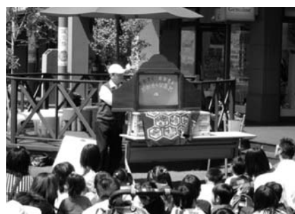
趣味を活かして紙芝居をしている人は？

みなさんのまちは、たくさんのボランティアの力で支えられています！ “ボランティア”にもいろいろな活動がありますが、大分市社会福祉協議会では、地域住民どうしが互いに支え合い・助け合える地域のボランティア活動を積極的に支援しています。