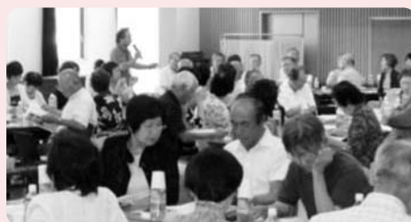
校区ボランティア連絡会の様子

8月29日(月)に、大分市社会福祉センターにて36の校(地)区ボランティア代表者及び校(地)区社協関係者など97名の参加のもと、「校区ボランティア連絡会」が開催されました。この連絡会は初めての開催で、参加したボランティアさん達は、それぞれの組織づくりや、今後の活動について話し合いました。