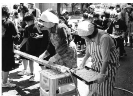
そうめん流しの準備をしている人は？