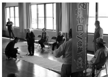
ふれあいサロン活動のスタッフは？