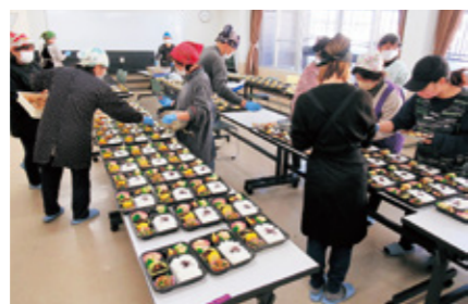
校(地)区社協活動の充実

地域の支援を要するひとり暮らし高齢者等を対象に、小地域(概ね自治会)で住民相互の見守り活動や生活課題に対する話し合い、助け合いを行います。