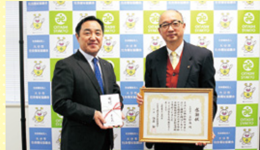
宗教法人真如苑 様