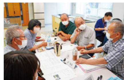
小地域福祉ネットワーク活動

地域の支援を要するひとり暮らし高齢者等を対象に、小地域(概ね自治会)で住民相互の見守り活動や生活課題に対する話し合い、助け合いを行います。