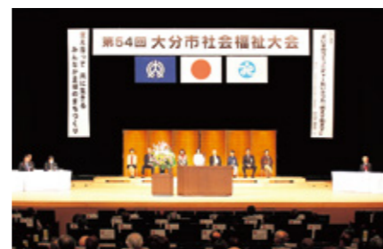
大分市社会福祉大会