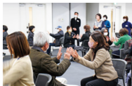
地域福祉活動ボランティア育成事業