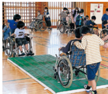
車いすの使い方を学ぶ