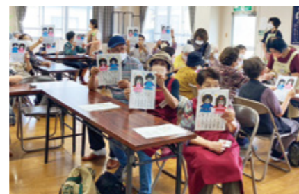
大分市地域ふれあいサロン

食事会やお弁当配付、生活支援活動など、地域の特色に応じた様々な活動を行っています。