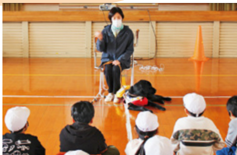
盲導犬のはたらきを学ぶ