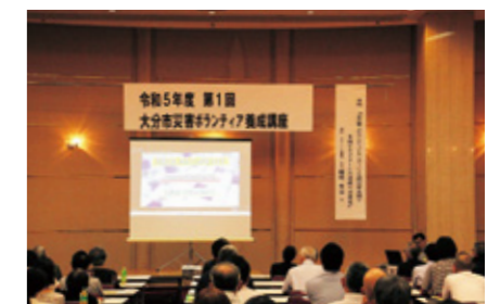
災害ボランティア活動支援体制整備事業

生活困窮者の自立相談や生活福祉資金の貸付など、生活の困りごとに関する相談をお受けしています。