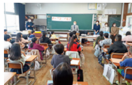
福祉教育支援事業