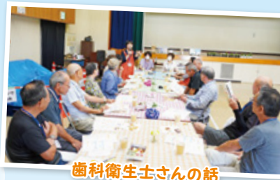
歯科衛生士さんの話