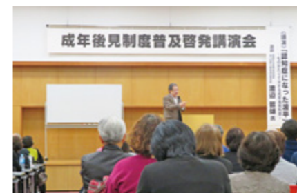
大分市成年後見センター事業

判断能力が十分でない方が安心して生活を送ることが出来るよう、成年後見制度に関する相談対応や普及啓発等を行っています。